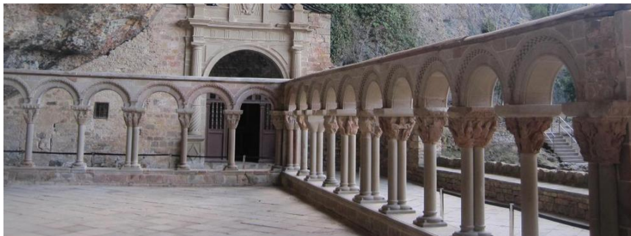
Monasterio de San Juan de la Peña, en Huesca.